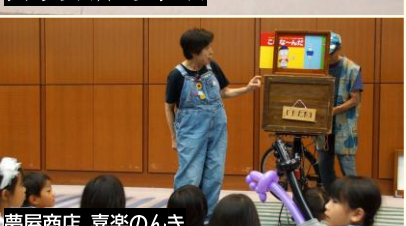
夢屋商店 喜楽のんき