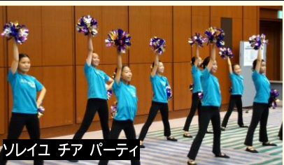
ソレイユ チア パーティ