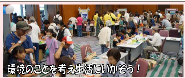
環境のことを考え生活にいかそう!