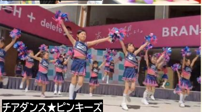
チアダンス★ピンキーズ