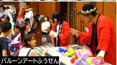
バルーンアートふうせん